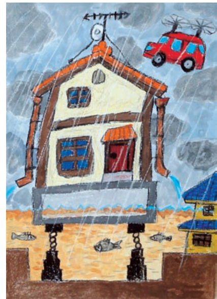
第 22 回みやぎ未来の科学の夢絵画展 宮城県知事賞